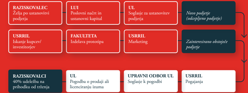
Zgornji diagram prikazuje postopek prevzema službenega izuma.